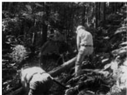
①森林整備活動の様子

平成22年度は受講を希望される方が所定人数(概ね6人以上)になった場合のみ講座の開講を予定しており、今回事前に受講希望者の募集を行います。多くの方のご応募をお待ちしています。