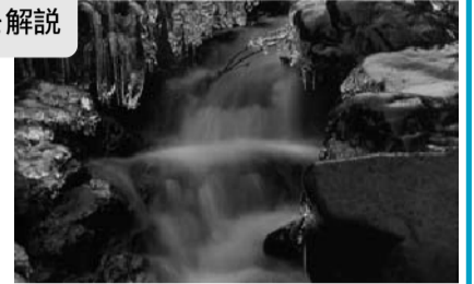
①写真集「あしあと」から(尺代)