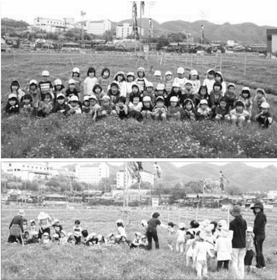
4月17日開園のレンゲ畑にて第二保育所・第四保育所の子どもたちです

第144号(通巻第236号) 平成22(2010)年5月23日 発行 島本町議会 編集 議会だより編集委員会 TEL (075)962-6315 FAX (075)962-6322