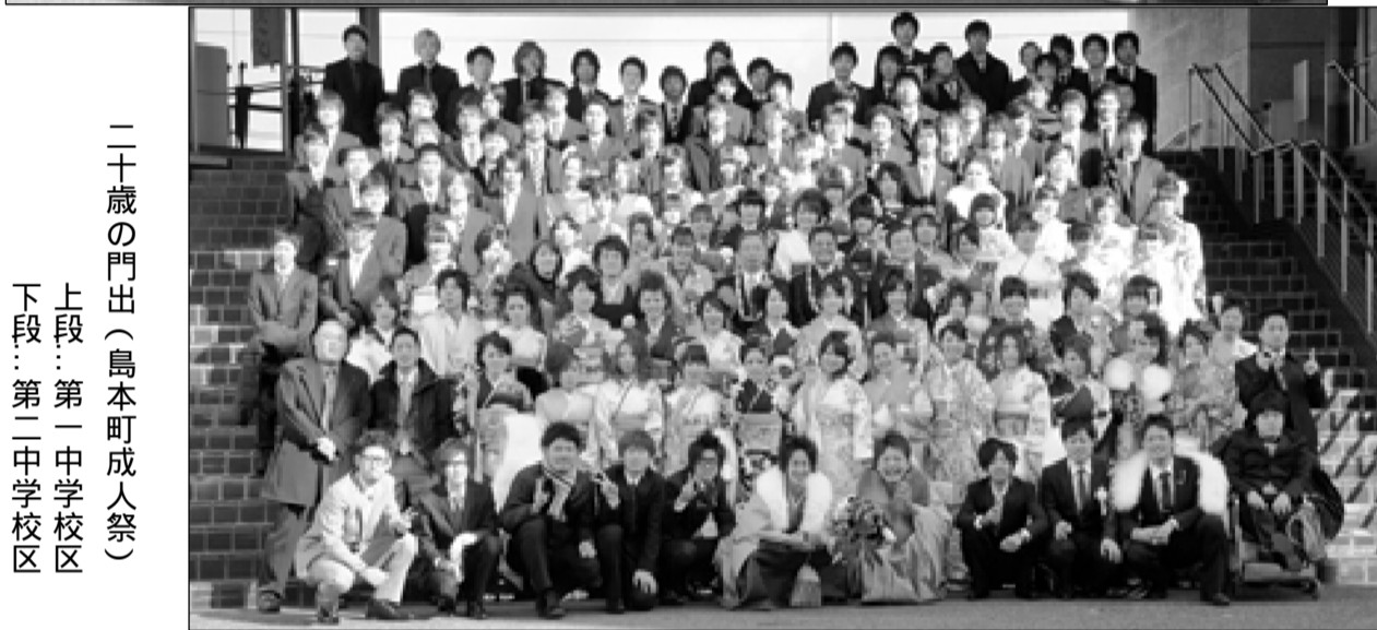
二十歳の門出(島本町成人祭) 上段:第一中学校区 下段:第二中学校区