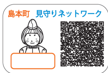
↑見守りQRコードシール例 大きさ：縦25mm×横45mm

行方不明になるおそれのある認知症高齢者等の、衣服や持ち物などに貼るシールです。ドライヤーやアイロンで簡単に貼り付けることができ、高齢者が行方不明になられた場合でも、その後保護された際にQRコードをスマートフォン、携帯電話で読み込むと、メッセージと町の連絡先が表示されます。保護された後、スムーズな連絡と身元確認のため、ぜひご利用ください。